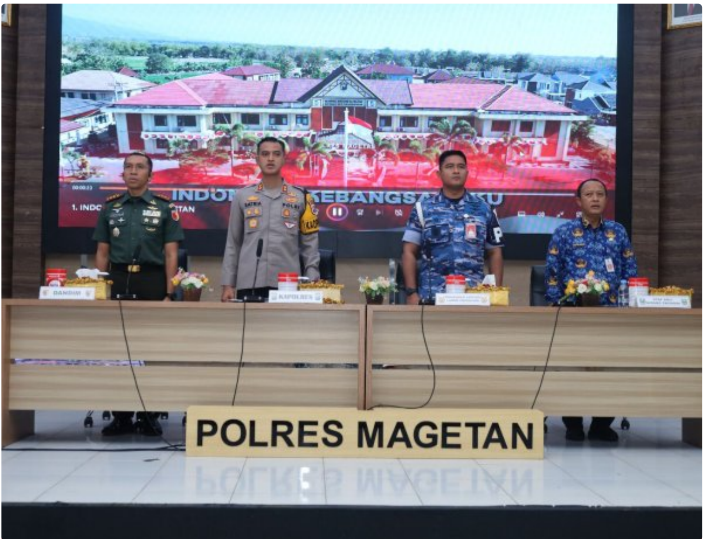
Dandim 0804/Magetan Hadiri Rakor Lintas Sektoral kesiapan operasi lilin 2024

Magetan. – Guna meningkatkan Sinergitas dalam rangka kesiapan operasi lilin 2024 pengamanan Hari Raya Natal 2024 dan Tahun Baru 2025 di wilayah Kabupaten Magetan yang aman dan kondusif.