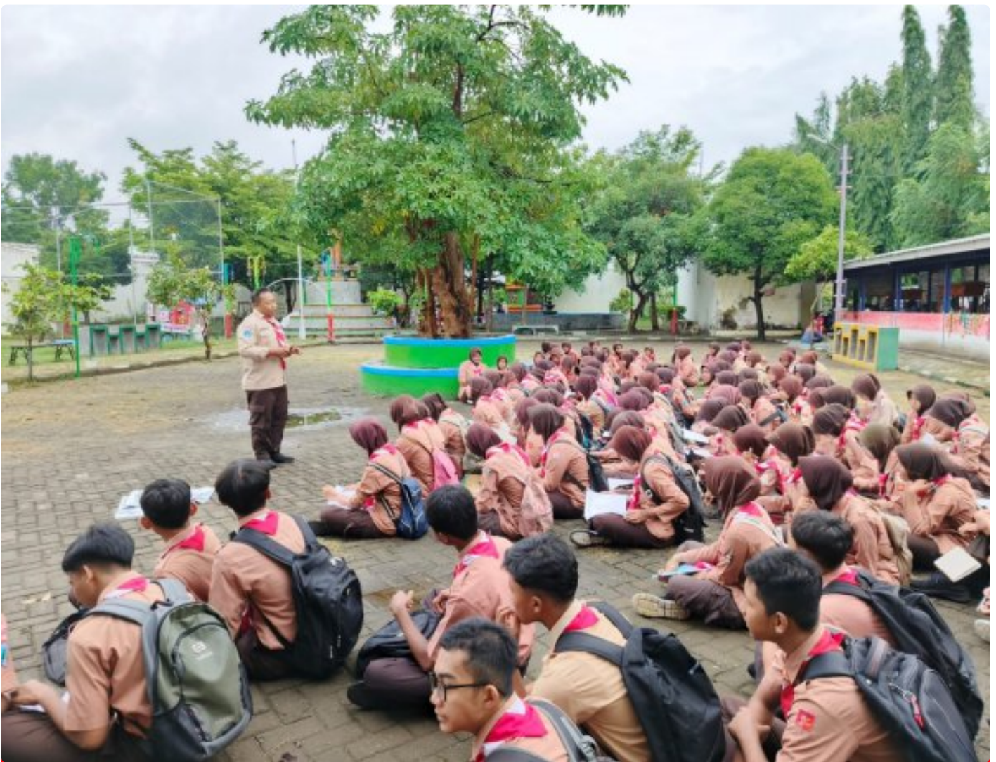
Pembinaan Pramuka Saka Wira Kartika Materi Krida Navigasi Darat Untuk Pengembangan Keterampilan

Magetan. - Dalam rangka memperkuat kemampuan dan keterampilan anggota Pramuka Saka Wira Kartika melaksanakan pembinaan dan pelatihan Krida Navigasi Darat (Navrad). Acara ini diikuti oleh 125 orang anggota pramuka dari berbagai gugus depan yang bertujuan untuk membekali para anggota Pramuka